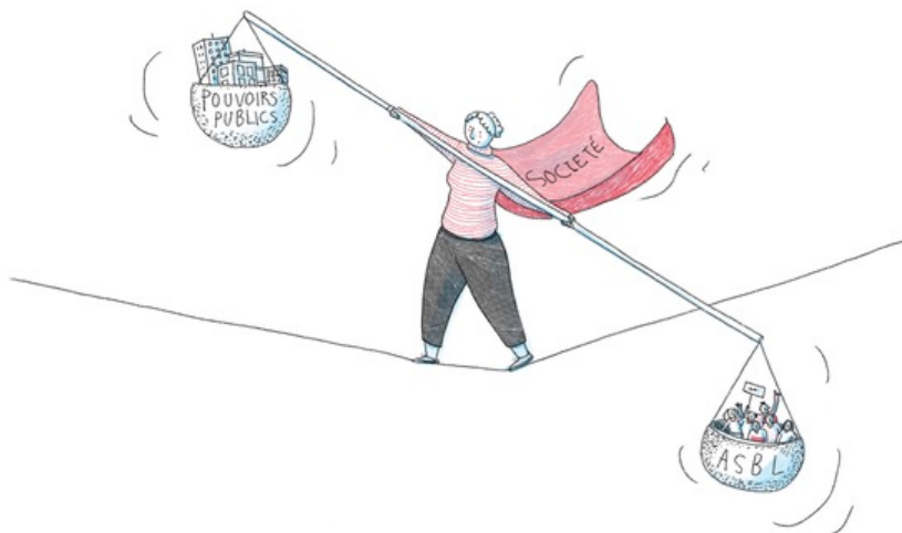
Illustration : Prisca Jourdain © CBCS

9. Acteur de la proximité, explorateur de la réalité du terrain, l'Associatif doit assurer une implication locale dans la chose publique et une présence sensée dans ses sphères de concertation.