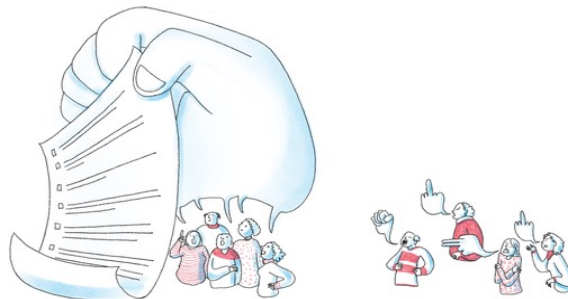
Illustration : Prisca Jourdain

5. Les pouvoirs publics doivent traiter de façon égale et non discriminatoire les acteurs de services d'intérêt général et reconnaître l'expertise et les compétences associatives.