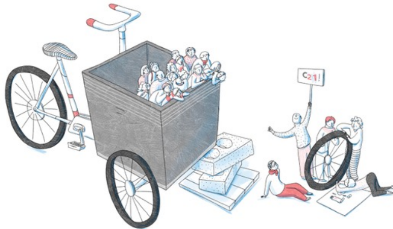
Illustration : Prisca Jourdain © CBCS

13. L'action associative doit se libérer de toute subordination édictée sur le motif qu'elle reçoit de l'argent de l'État : les subventions ne sont qu'une juste redistribution et un investissement de tous au profit du bien commun.